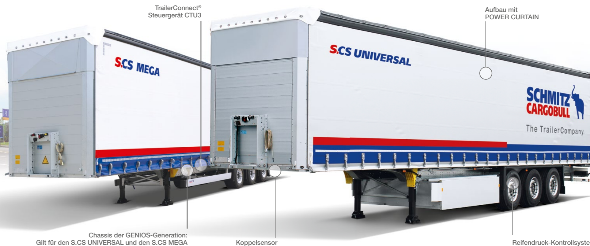
Chassis der GENIOS-Generation: Gilt für den S.CS UNIVERSAL und den S.CS MEGA

* Das SMART PLUS Paket ist verfügbar für den S.CS UNIVERSAL und den S.CS MEGA, auch inkl. der Ausstattungsvarianten für den Coil- und Paper-Transport, für die jeweiligen X-LIGHT-Konfigurationen aller Typen.