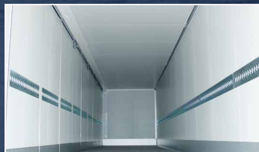
Indvendig opbygget med metal overflade, alu. bund og høje skurrelister, som sikrer de perfekte hygiejniske forhold.

Fleksibel og effektiv. Den perfekte all-rounder til dine behov.