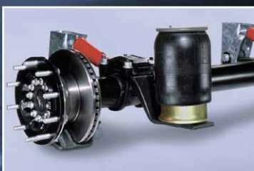
ROTOS® aksler med 1st. classes komponenter