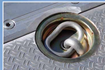
Option: Indbygget surrin gsringe i bunden