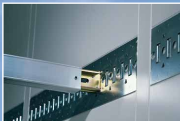
Lastsikringskinner indfældet i siden uden nitter og bjælker