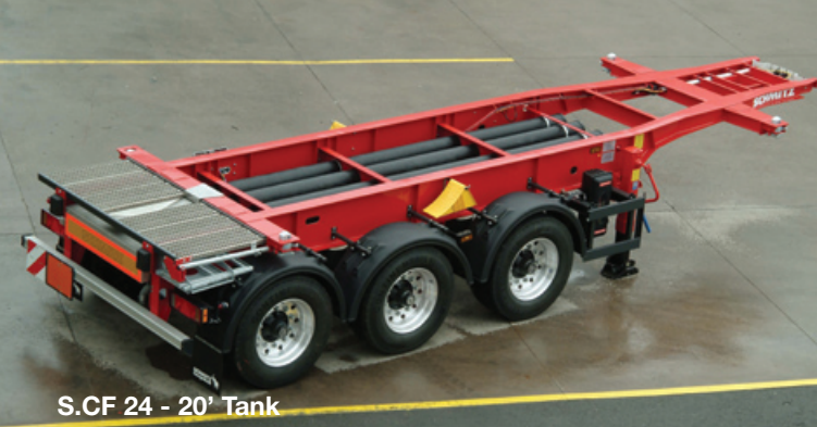
S.CF 24 - 20' Tank