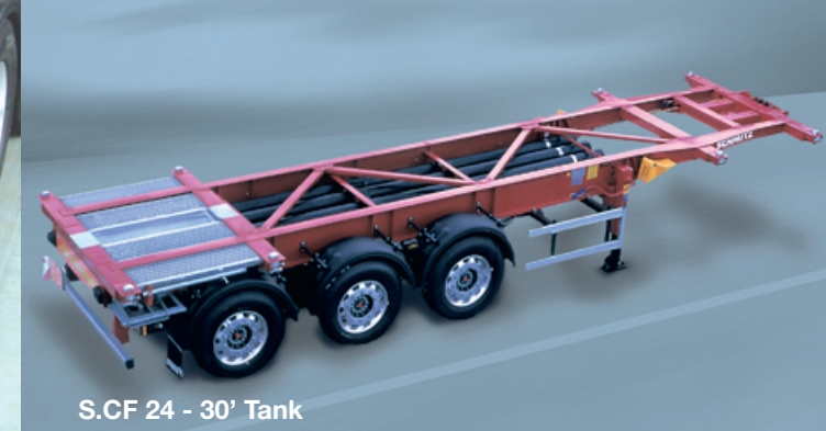
S.CF 24 - 30' Tank